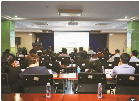
▲区司法局邀请办理未成年人案件的资深检察官为团队律师以沙龙互动的形式开展业务培训。

为向涉法涉诉的未成年人提供更好的法律援助和法律服务，福田区首创组建未成年人权益保护法援律师专业办案团队。11月16日上午，福田区司法局举办“福田区未成年人权益保护法援律师团”成立仪式暨业务培训活动。福田司法局通过组建法援律师专业办案团队，扩展未成年人案件法援受案范围，引入与社会慈善基金组织合作方式等举措，全面创新福田区未成年人权益保护法援工作模式。