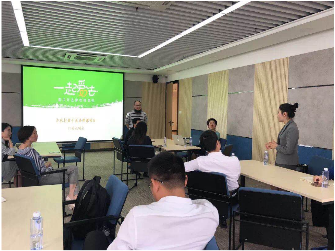
(11月2日农村小规模学校普法培训会现场)