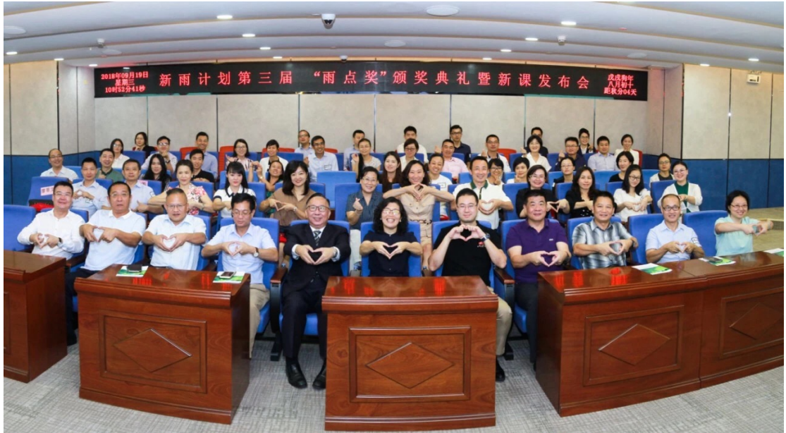
(11月19日第三届青少年普法“雨点奖”现场)