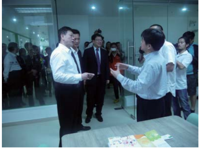
深圳市委副书记戴北方、福田区区委书记张文、副书记苗宁礼视察维德中心，蔡文生理事介绍工作。