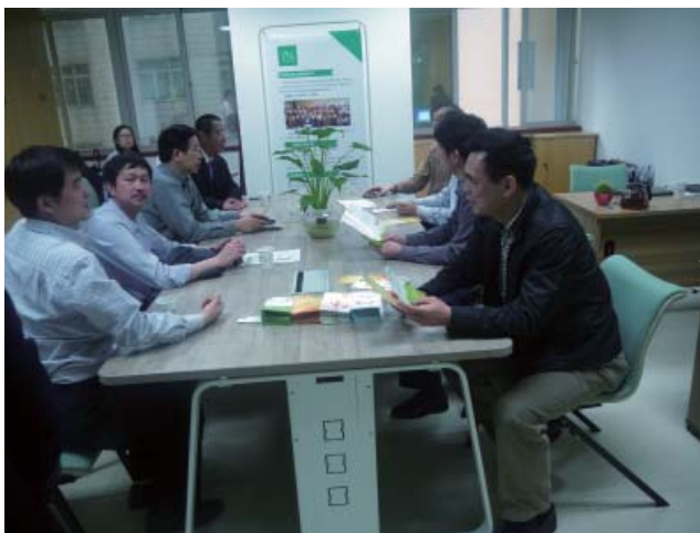
福田区各街道办事处到维德中心座谈