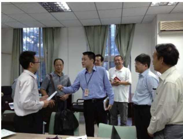
福田区政协副主席王跃平到维德中心视察调研