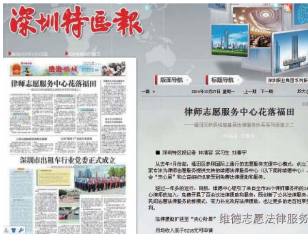
深圳特区报大幅报道维德中心