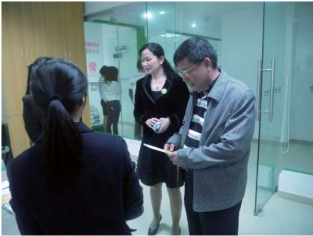
深圳市政法委副书记陈志新视察维德中心